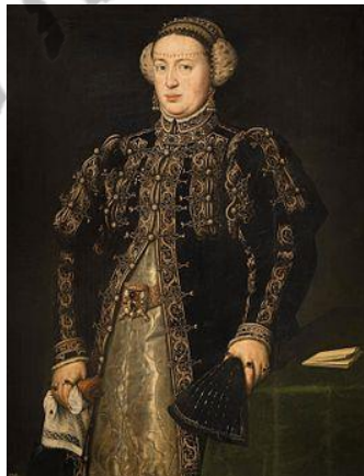
Catharina van Oostenrijk

Aangezien Sebastiaan toen nog een zuigeling was, werd het regentschap overgedragen eerst aan zijn grootmoeder, Catharina van Oostenrijk (1507-1578), weduwe van Johan III en zus van Keizer Karel, daarna aan zijn grootoom, kardinaal Henrique van Evora, die hem later ook zou opvolgen.