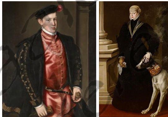
Johan Manuel van Portugal en Johanna van Habsburg

Hij was de zoon van prins Johan van Portugal en Johanna van Habsburg (dochter van keizer Karel V).