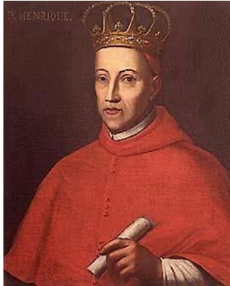
Hendrik van Portugal

Tijdens deze periode zette Portugal de koloniale uitbreiding voort in Angola, Mozambique, Malakka en vond de annexatie van Macau plaats.