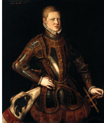
Koning van Portugal

Sebastiaan I (Portugees: Dom Sebastião I, bijnaam o Desejado) was de zestiende koning van Portugal.