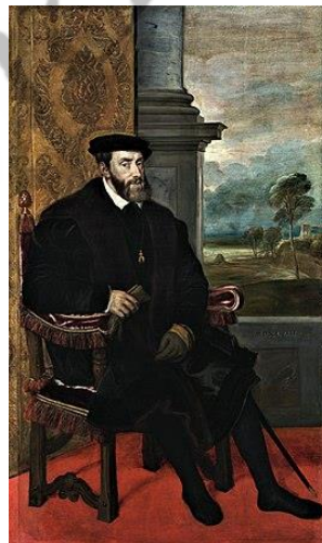
Keizer Karel V