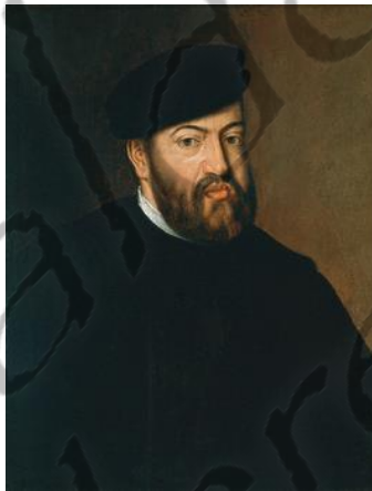
Johan III van Portugal

Hij volgde in 1557 zijn grootvader, Johan III van Portugal, op omdat hij na de dood van zijn vader, prins Johan van Portugal in 1554 (twee weken vóór zijn geboorte) de eerste in lijn van opvolging was.