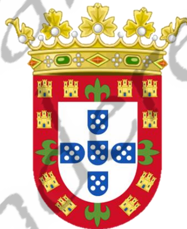
Wapen van het Koninkrijk Portugal (1385-1580)