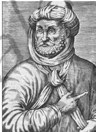
Ahmed Mohammed van Fez

Het Portugese leger, dat grotendeels bestond uit slecht getrainde buitenlandse huurlingen (uit Duitsland, Nederland, Spanje en Italië), vertrok naar Marokko in 1578 en marcheerde, tegen het advies van zijn generaals, diep naar het binnenland om zich bij zijn Marokkaanse bondgenoten aan te sluiten. Bij de slag van Ksar-el-Kebir ("veld van de drie koningen") (Spaans: Alcazarquivir) troffen de Portugezen het leger van Ahmed Mohammed van Fez, waar de jonge en roekeloze Sebastiaan hoogstwaarschijnlijk in de slag sneuvelde. Ondanks de waarschuwingen van vele van zijn onderdanen om te vluchten, reed hij met zijn paard in op de vijandelijke linies waar hij nog wild vechtend was gezien.