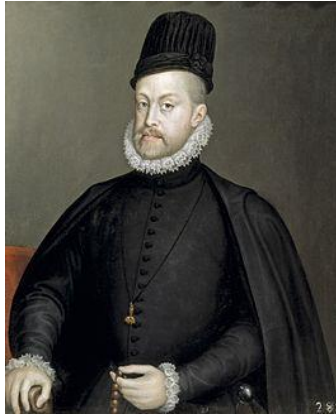
Filips II van Spanje

Het Portugese leger, dat grotendeels bestond uit slecht getrainde buitenlandse huurlingen (uit Duitsland, Nederland, Spanje en Italië), vertrok naar Marokko in 1578 en marcheerde, tegen het advies van zijn generaals, diep naar het binnenland om zich bij zijn Marokkaanse bondgenoten aan te sluiten. Bij de slag van Ksar-el-Kebir ("veld van de drie koningen") (Spaans: Alcazarquivir) troffen de Portugezen het leger van Ahmed Mohammed van Fez, waar de jonge en roekeloze Sebastiaan hoogstwaarschijnlijk in de slag sneuvelde. Ondanks de waarschuwingen van vele van zijn onderdanen om te vluchten, reed hij met zijn paard in op de vijandelijke linies waar hij nog wild vechtend was gezien.