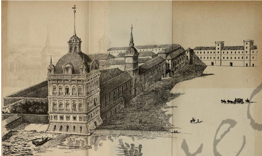
Ribeira Palace: geboorteplaats van Sebastiaan

Hij volgde in 1557 zijn grootvader, Johan III van Portugal, op omdat hij na de dood van zijn vader, prins Johan van Portugal in 1554 (twee weken vóór zijn geboorte) de eerste in lijn van opvolging was.