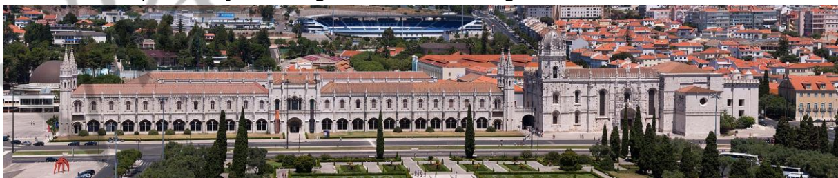
Jerónimosklooster in Santa Maria de Belém

Of zijn lichaam ooit gevonden is, is onzeker, maar Koning Filips II van Spanje claimde zijn overblijfselen te hebben begraven in het Jerónimosklooster in Santa Maria de Belém, gelegen buiten Lissabon, nadat hij de Portugese troon had bestegen in 1580.