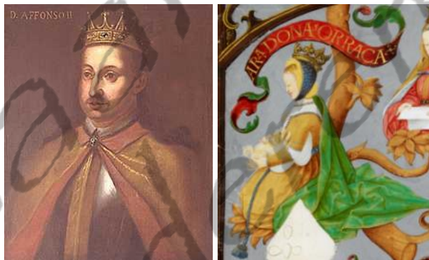
Alfons II van Portugal en Urraca van Castilië

Alfons was de tweede zoon van Alfons II van Portugal en diens vrouw Urraca van Castilië (1186-1220).