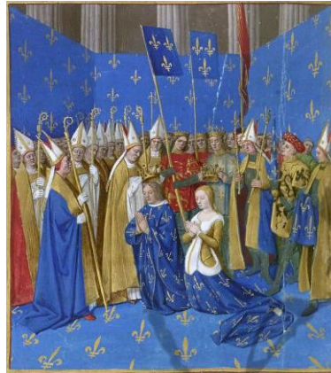
De kroning van Lodewijk VIII en Blanca

Alfons was geen kroonprins en verwachtte niet dat hij koning zou worden. Hij bracht veel tijd door in Frankrijk, waar hij in 1238 trouwde met Mathilde II van Boulogne, waardoor hij graaf van Boulogne werd. Rond 1240 echter, ontstond een conflict tussen de kerk en Sancho II. De tante van Alfons, Blanca van Castilië(1188-1252), de vrouw van Lodewijk VIII van Frankrijk, zag hierin een kans om Portugal, van oudsher een bondgenoot van Engeland in de strijd tegen de Fransen, aan de kant van de Fransen te krijgen.