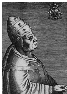
Paus Urbanus VI

Omdat hij hertrouwde voordat hiertoe door de paus toestemming was gegeven werd hij voor korte tijd in de ban gedaan. In 1262 hief paus Urbanus VI de ban op.