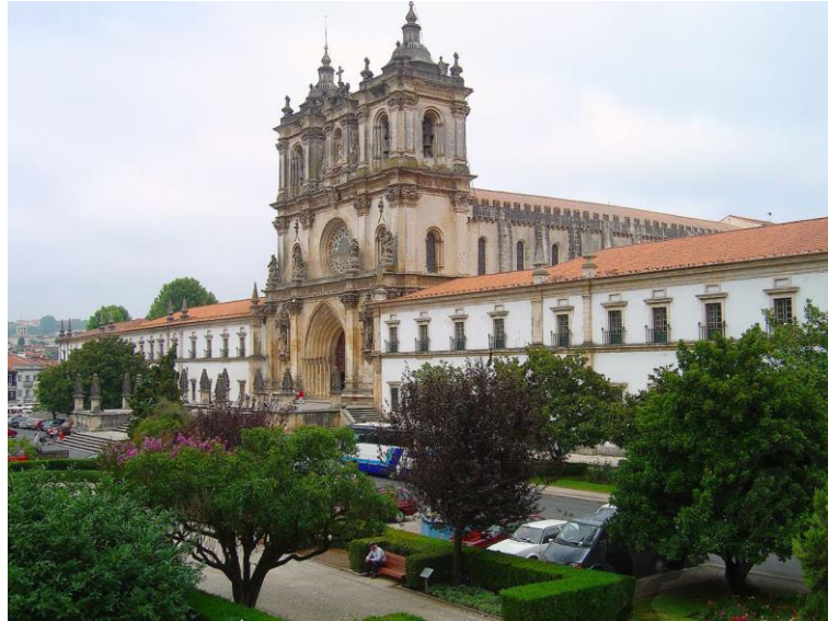
Klooster van Alcobaça