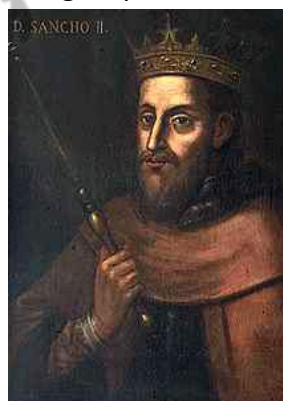
Sancho II van Portugal

Hij volgde zijn broer Sancho II van Portugal op.