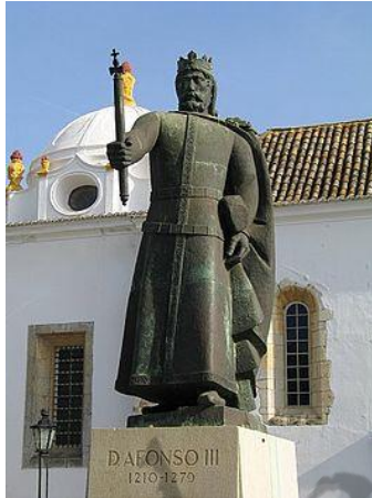
Koning van Portugal

Alfons III was koning van Portugal van 1247 tot 1279.