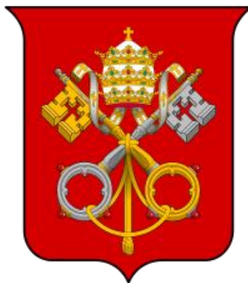
Embleem van de Heilige Stoel

Herman van Salza bemiddelde met de paus en de ridderorde werd met Gouden Bull van Rieti in 1234 onder de bevoegdheid van de Heilige Stoel gesteld.