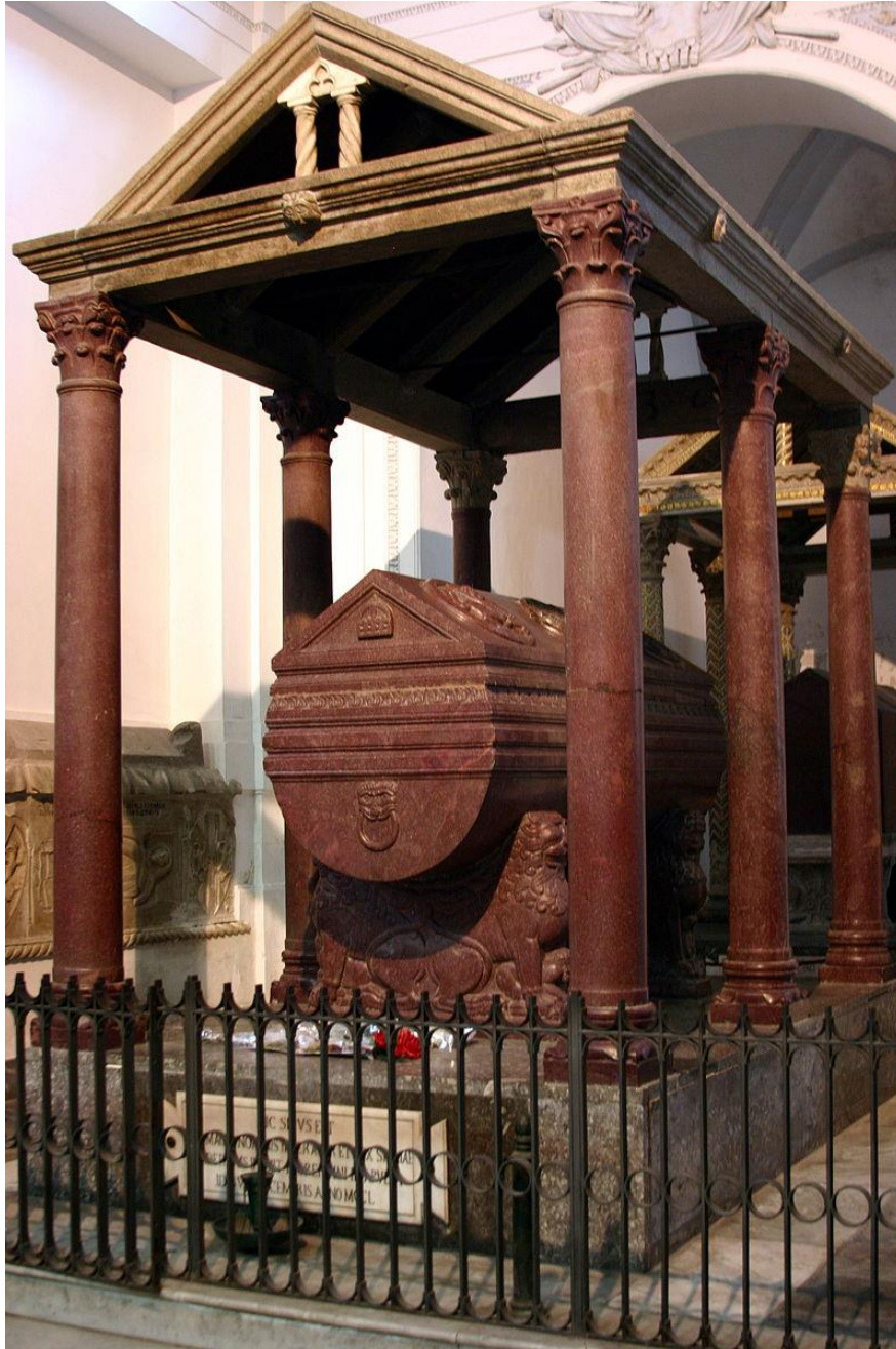
Sarcofaag van Frederik II in de kathedraal van Palermo