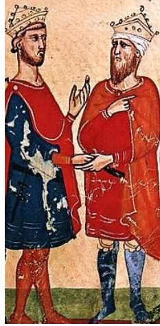
Frederik II (links) en Al-Kamil (rechts) bezegelen de vrede met een handdruk

vertrok hij uiteindelijk op kruistocht. De bedoeling van Frederik was om door middel van compromispolitiek de heilige plaatsen definitief open te stellen voor het Westen. In 1229 sloot hij in Egypte de tien jaar durende Vrede van Jaffa met sultan Al-Kamil van Egypte.