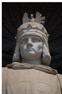
Standbeeld aan het Palazzo Reale in Napels