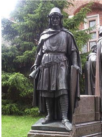
Herman van Salza

In 1226 tekende hij met hem de Gouden Bull van Rimini, waarbij Herman de toelating kreeg Kulmerland te veroveren als buffer tegen de Pruisen. Maar eerst moest Frederik zijn verplichting na komen, een kruistocht. Het feit dat Frederik geëxcommuniceerd was, wilden de andere ridderorden niet voor hem strijden, dus begeleidde de Duitse Orde, de keizer en koning van Jeruzalem, naar het Heilige Land.