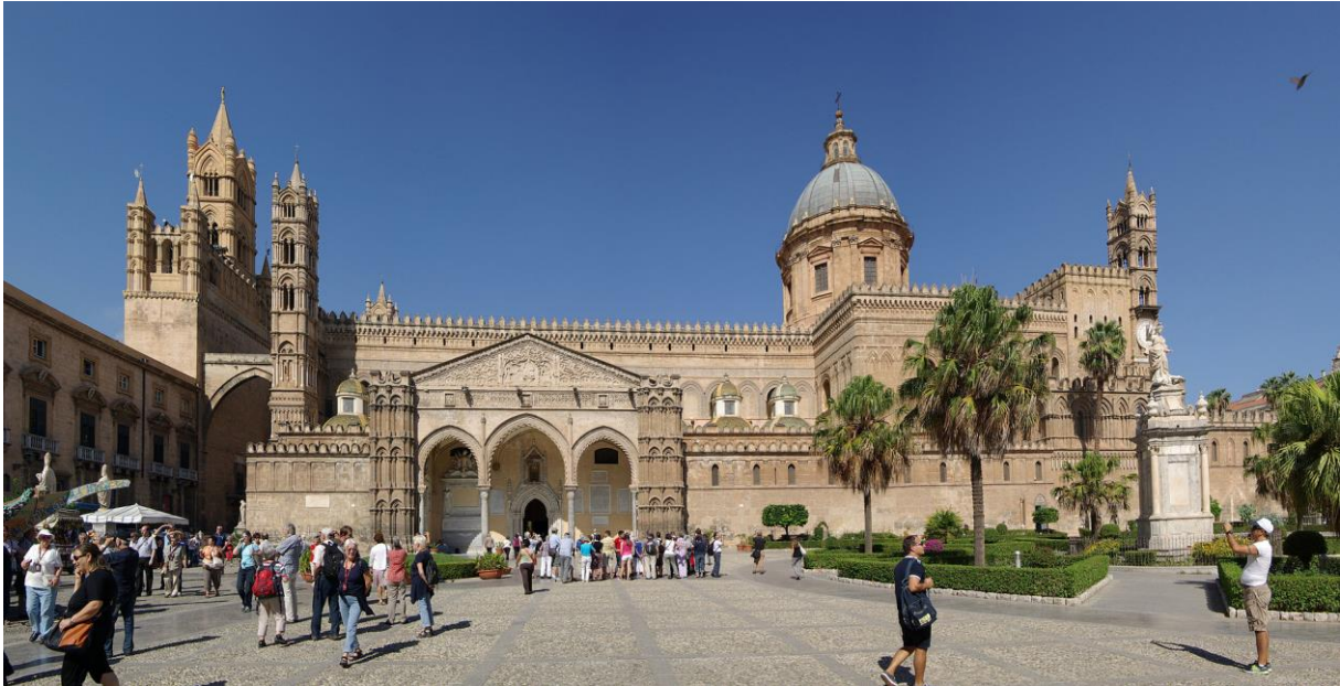
Kathedraal van Palermo

werd opgediept. Deze wordt tentoongesteld in de schatkamer van de kathedraal van Palermo.