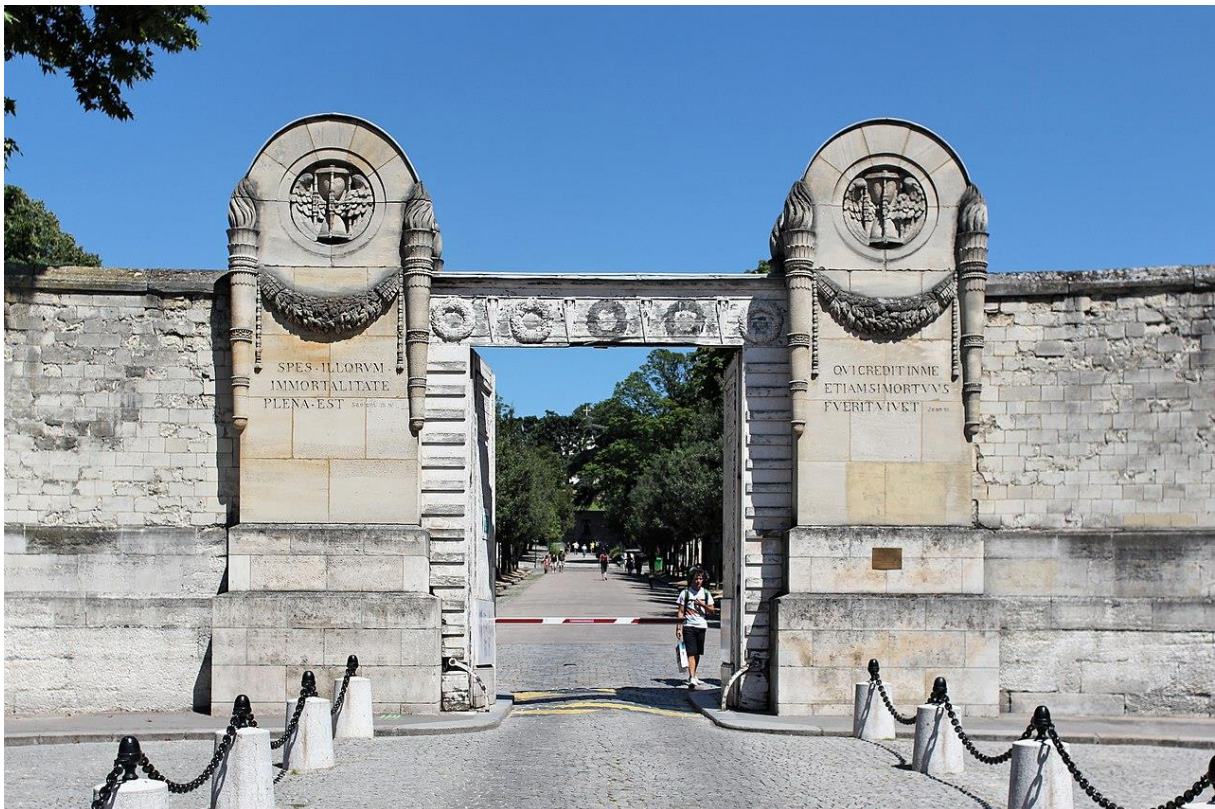
Ingang van de begraafplaats: Pere Lachaise

Murats geboorteplaats Labastide-Fortunière heet tegenwoordig Labastide-Murat.