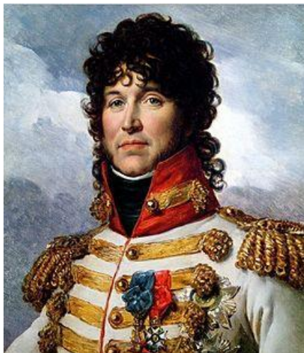
Groothertog van Berg

Joachim Murat was een zwager van Napoleon Bonaparte en van 1808 tot 1815 koning van Napels.