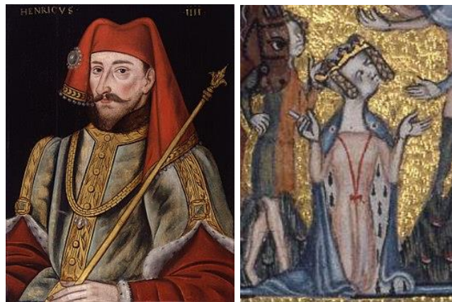
Vader en moeder: Hendrik IV en Maria de Bohun.

Als kind genoot Hendrik onderwijs aan de Universiteit van Oxford. Op 2 juni 1420 trouwde Hendrik met Catharina van Valois, de dochter van koning Karel VI van Frankrijk. Het echtpaar kreeg één kind: