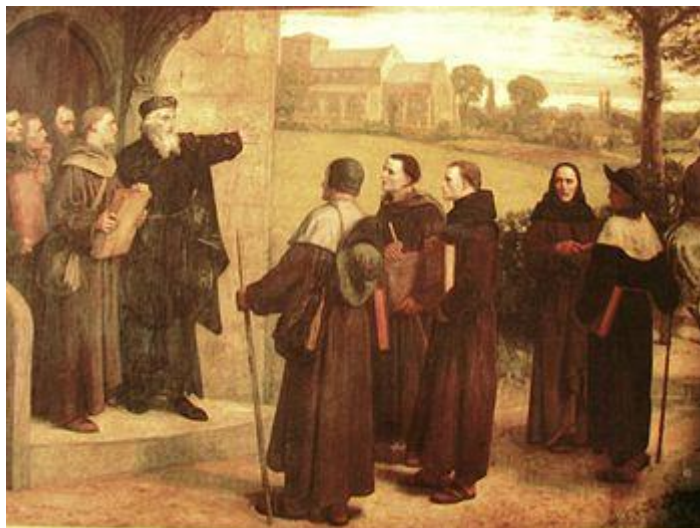
John Wycliffe geeft zijn Bijbelvertaling aan Lollardaanhangers

Nadat hij een opstand van de Lollards (of Lollarden, een radicale afsplitsing van de beweging van John Wyclif) onder John Oldcastle had onderdrukt, trok hij naar Frankrijk.