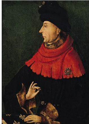
Jan zonder Vrees

In augustus 1417 keerde Hendrik terug naar Frankrijk en veroverde hij stelselmatig Normandië. Na de dood van Jan zonder Vrees bemiddelde diens zoon Filips de Goede tussen Hendrik en de Franse koning Karel VI.