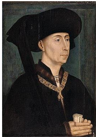
Filips de Goede

In augustus 1417 keerde Hendrik terug naar Frankrijk en veroverde hij stelselmatig Normandië. Na de dood van Jan zonder Vrees bemiddelde diens zoon Filips de Goede tussen Hendrik en de Franse koning Karel VI.