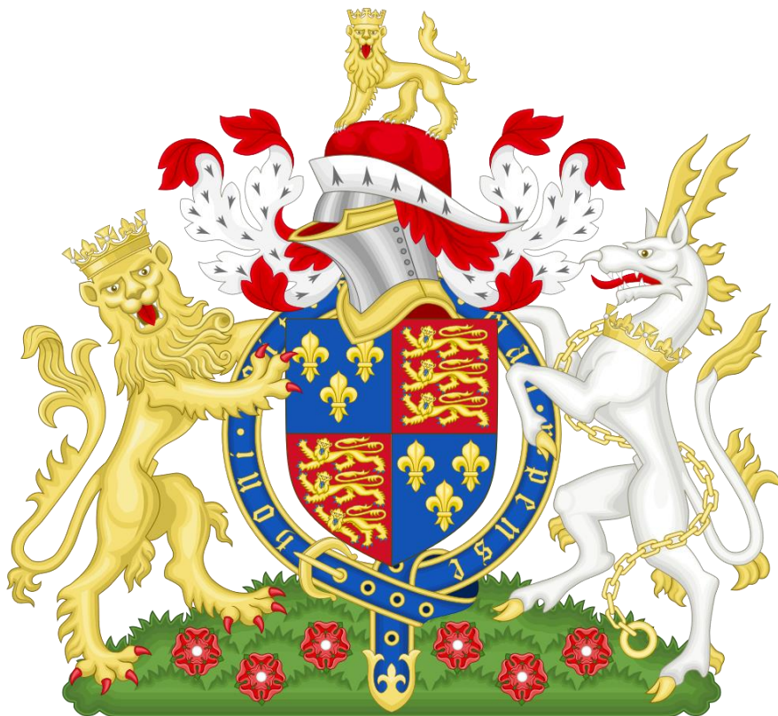
Wapen van Hendrik als koning van Engeland