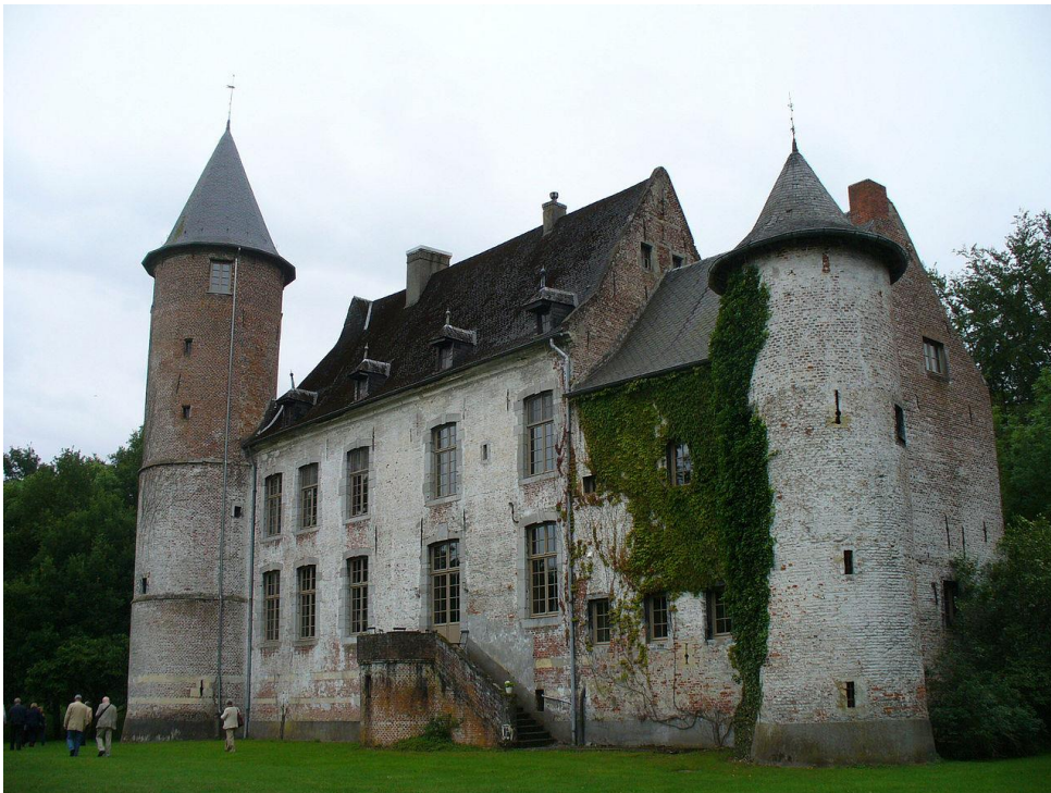
kasteel Den Dool