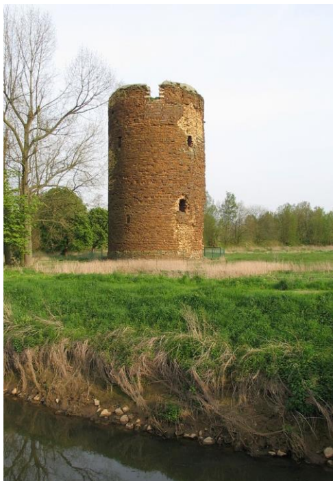
De Maagdentoren in mei 2006, vlak voor hij op 1 juni gedeeltelijk instortte

In 1371 volgde Reinoud II hem op als heer van Zichem; als drossaard van Brabant was hij bovendien ook pandheer van het graafschap Dalhem en het graafschap Kerpen. In 1386 vermoordde hij graaf Jan II van Gronsveld, heer van het rijksgraafschap Gronsveld, mogelijk op aanstoken van de hertog van Gelder, want datzelfde jaar begon de oorlog tussen Brabant en Gelder. Waarschijnlijk liet hij naar aanleiding van deze oorlog de Maagdentoren in Zichem bouwen.