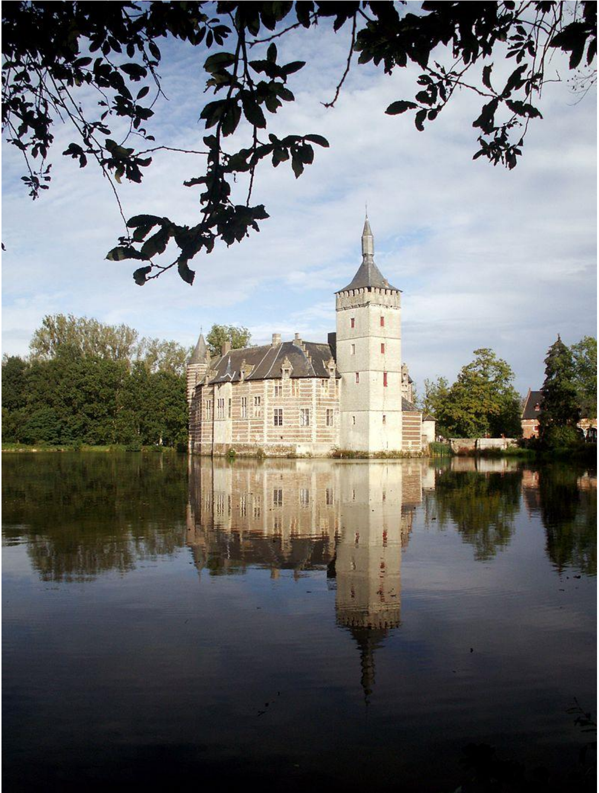
kasteel van Horst