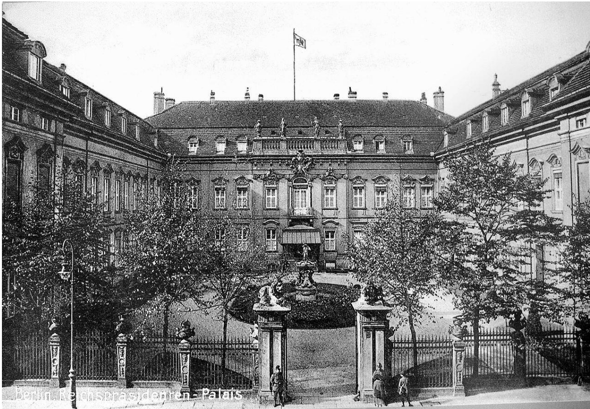
Rijkspresidentenpaleis op de Wilhelmstraße in Berlijn.

Ebert steunde de Burgfrieden en probeerde de oorlogstegenstanders in de partij te isoleren. Na de oorlog en het einde van de monarchie diende hij als de eerste president van Duitsland, van 1919 tot zijn dood.