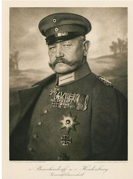
Paul von Hindenburg