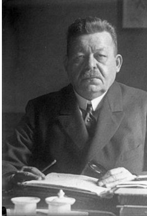
1e Rijkspresident van Duitsland

Friedrich Ebert was een Duits politicus van de Sociaaldemocratische Partij van Duitsland (SPD).