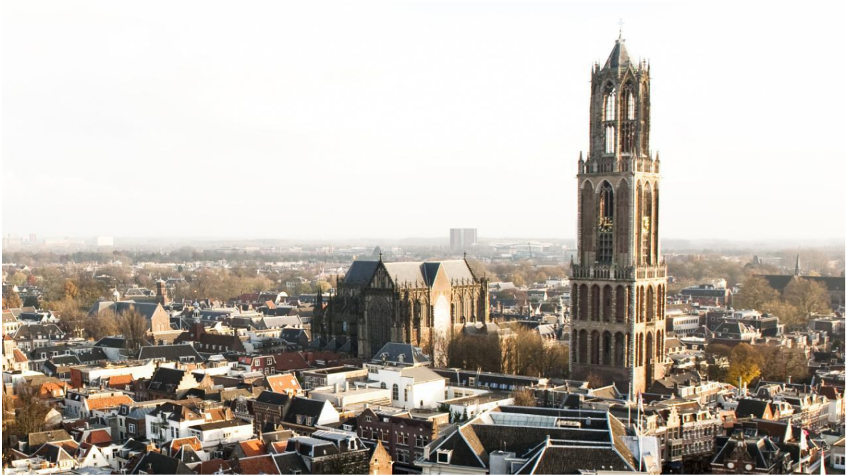
Domkerk van Utrecht