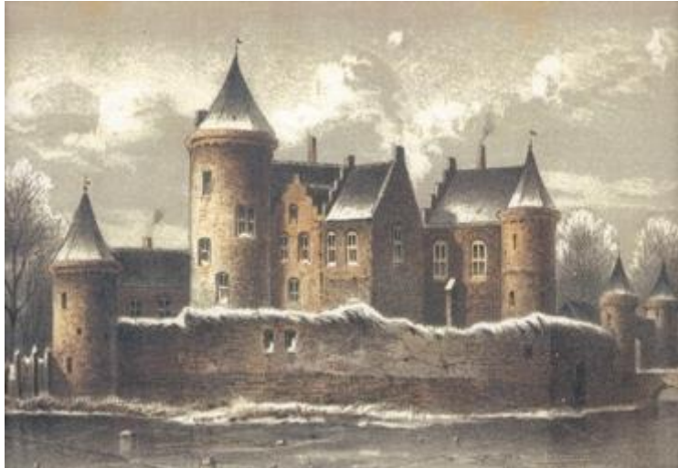
Rond 1253 werd het slot Vredelant gebouwd in opdracht van de Utrechtse bisschop Hendrik van Vianden