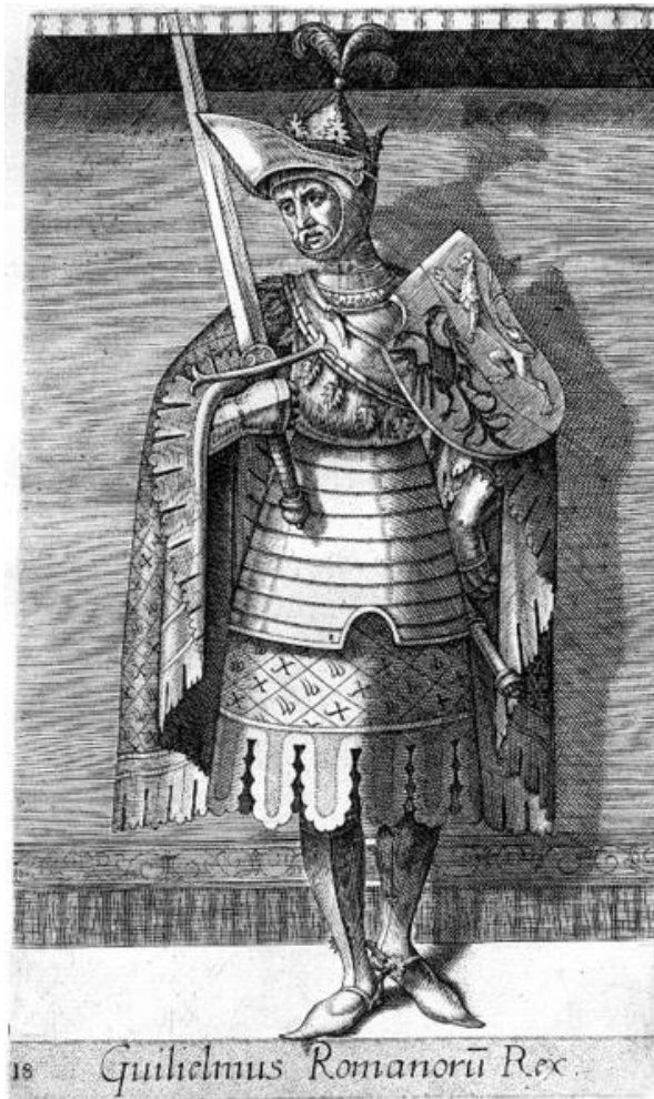
Willem II van Holland

Hendrik steunde de Duitse tegenkoning Willem II van Holland, maar deze buitte de geschillen die ontstonden tussen Hendrik enerzijds en de adel en de stad Utrecht anderzijds uit voor eigen gewin.