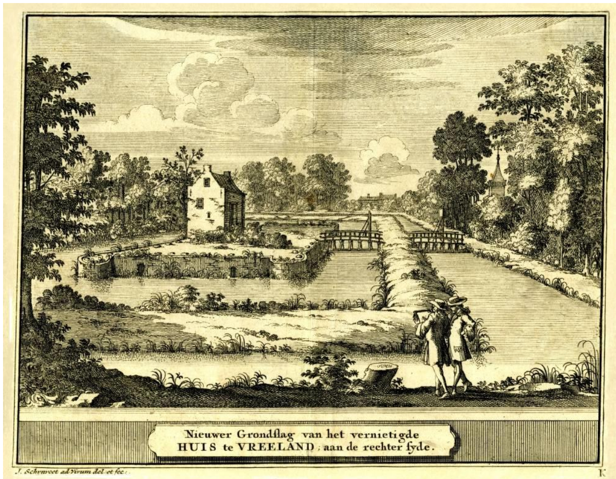
Ruïne van kasteel Vredelantgravure door Jacobus Schijnvoet, 1711

In 1254 legde hij de eerste steen voor de gotische Domkerk van Utrecht, nadat het oude kerkgebouw in 1253 door de negendaagse stadsbrand geteisterd was. Hij werd ook in de Dom begraven.