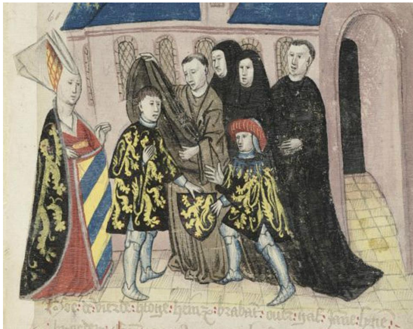
Miniatuur die de vervanging van Hendrik IV door Jan I weergeeft (uit de Brabantsche Yeesten van Jan van Boendale; Koninklijke Bibliotheek van België, MS IV 684)