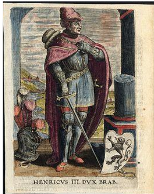
Hendrik III van Brabant

Na de dood van Hendrik III van Brabant, vochten hij, Otto II van Gelre en Hendrik I van Hessen om de voogdij over diens jonge zonen, maar het was uiteindelijk hun moeder Aleidis van Bourgondië die de voogdij over haar zoon Hendrik IV van Brabant en nadien over Jan I van Brabant wist in handen te krijgen