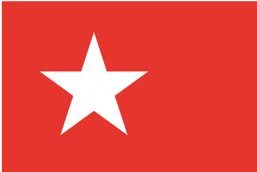
tweeherigheid van Maastricht

In 1284 zou hij samen met zijn broer Arnoud van Diest in het kader van de strijd om de tweeherigheid van Maastricht hebben gevochten.