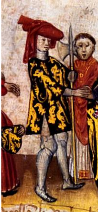
Jan I van Brabant