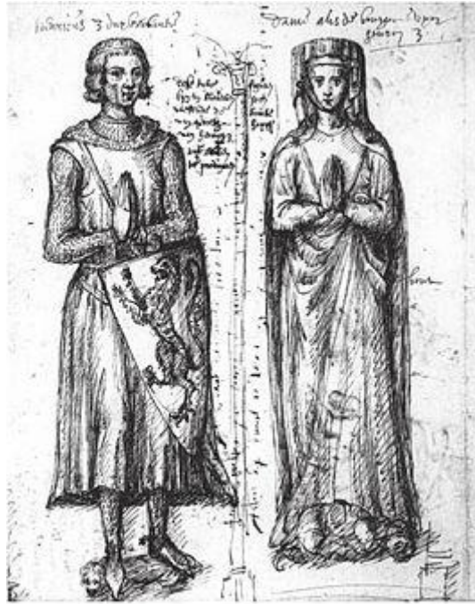
Hendrik III van Brabant en Aleidis van Bourgondië