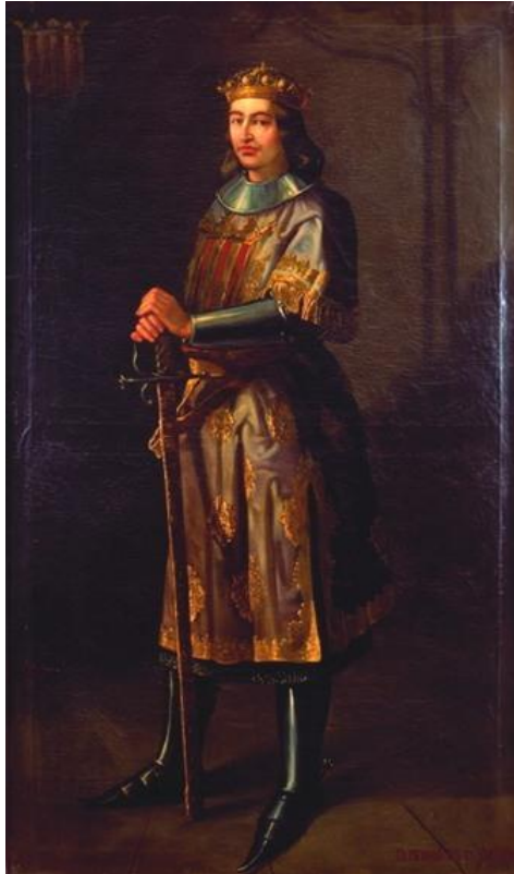
Peter III van Aragón