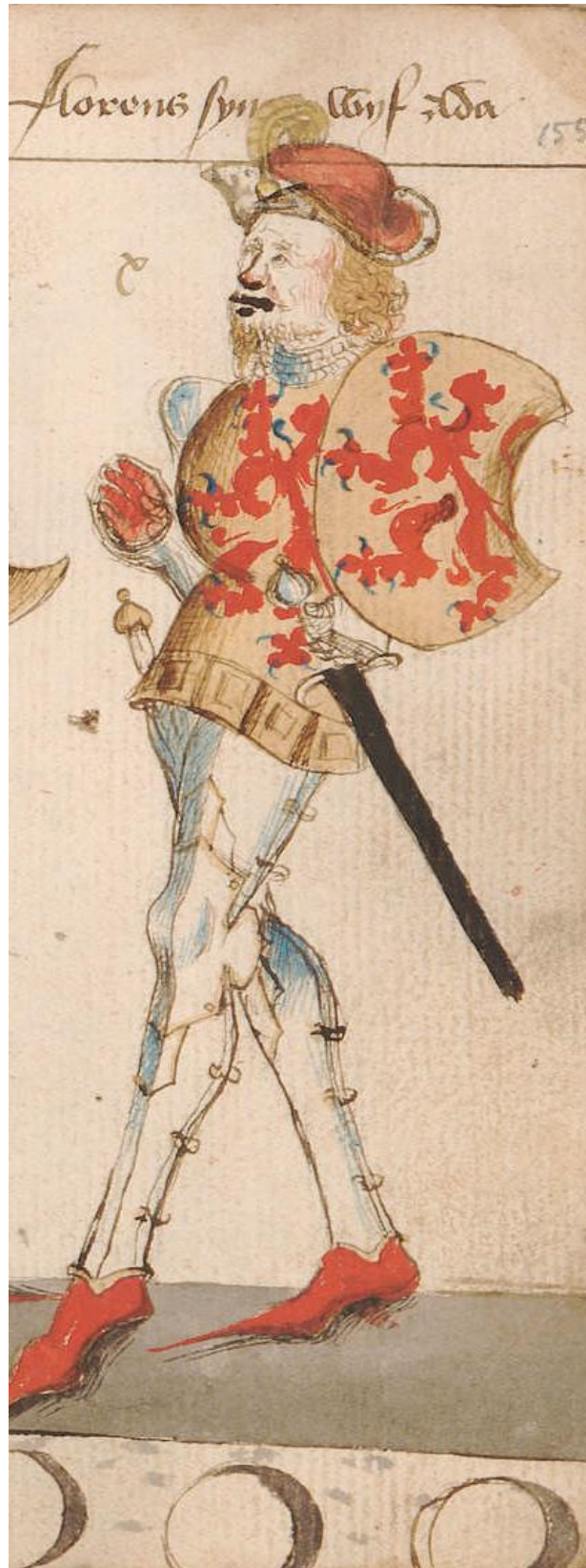
Floris III van Holland