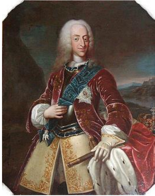
Christiaan VI van Denemarken