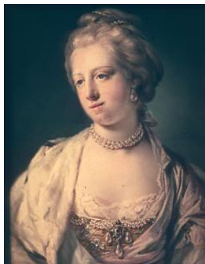
Caroline Mathilde van Wales