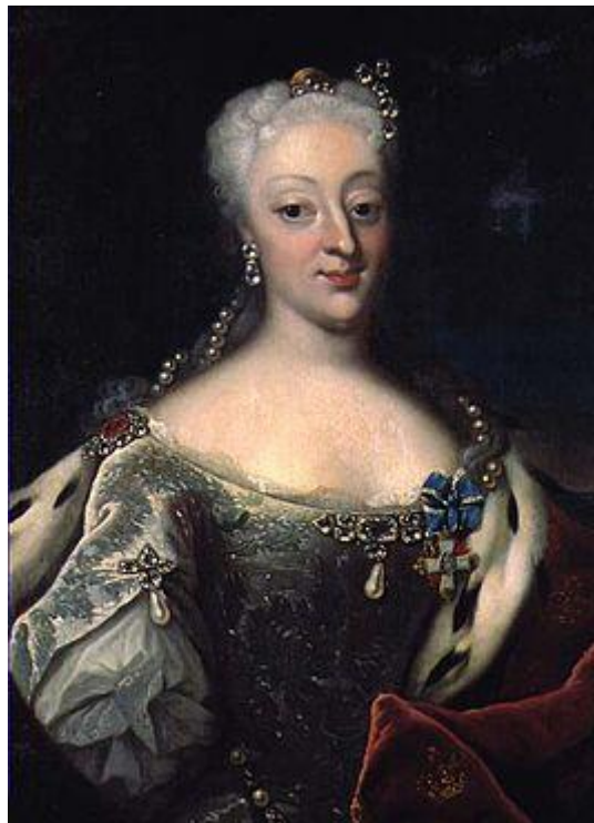
Sophia Magdalena van Brandenburg-Kulmbach

Hij was eerst getrouwd met Louise, dochter van George II van Groot-Brittannië en Caroline van Brandenburg-Ansbach.