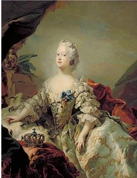
Louise van Hannover

Samen hebben zij zeven kinderen gekregen, van wie er vijf in leven zijn gebleven: