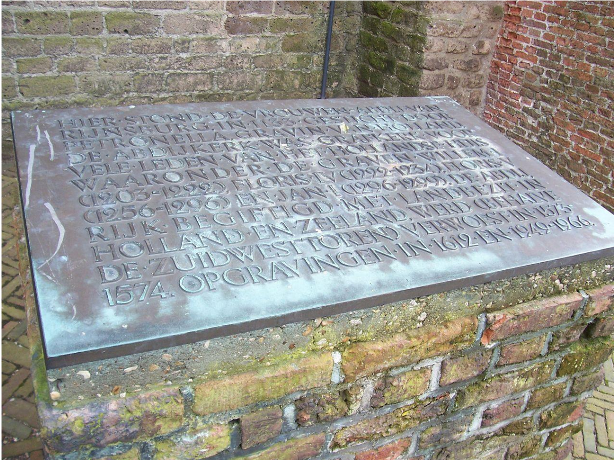
Tekst op de plaats waar de Abdi van Rijsburg stond

niet over zijn kant laten gaan en stak Floris dood. Floris werd begraven in de Abdi van Rijsburg.