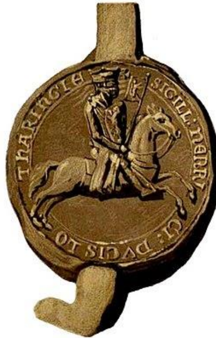
Ruiterszegel van Hendrik I van Brabant.

Floris trouwde met Machteld van Brabant, weduwe van Hendrik VI van Brunswijk. Op 5 november 1214 maakte zijn vader samen met Hendrik I van Brabant een huwelijksverdrag op waarin werd overeengekomen dat vanaf de dag van het huwelijk van Floris, zijn vader, graaf Willem elk jaar 500 Hollandse ponden zal betalen aan Machteld, de dochter van Hendrik van Brabant.