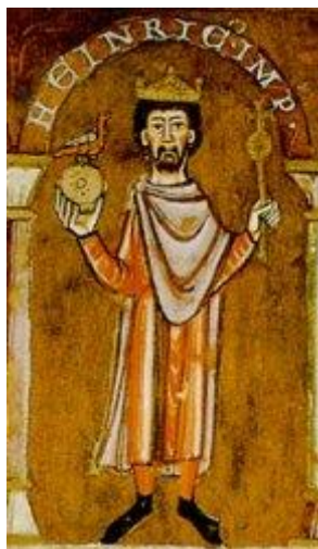
keizer Hendrik IV