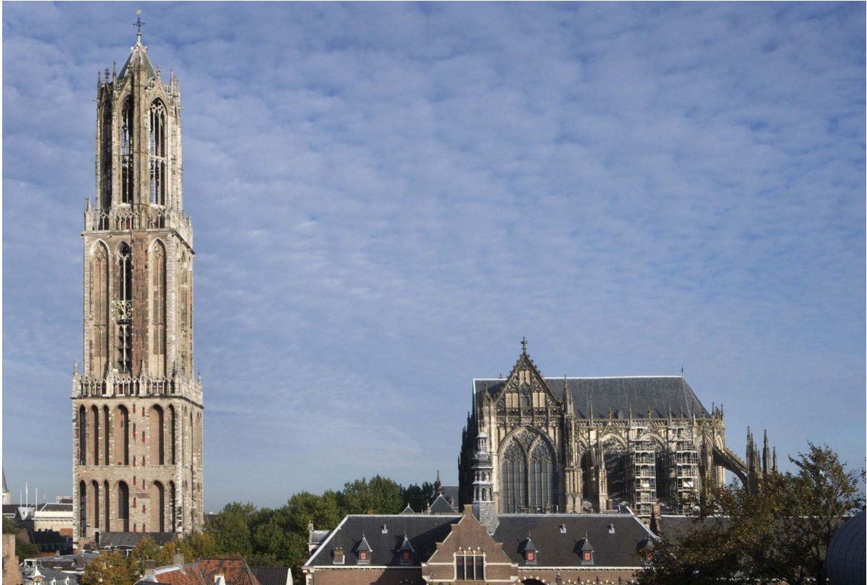
Dom van Utrecht