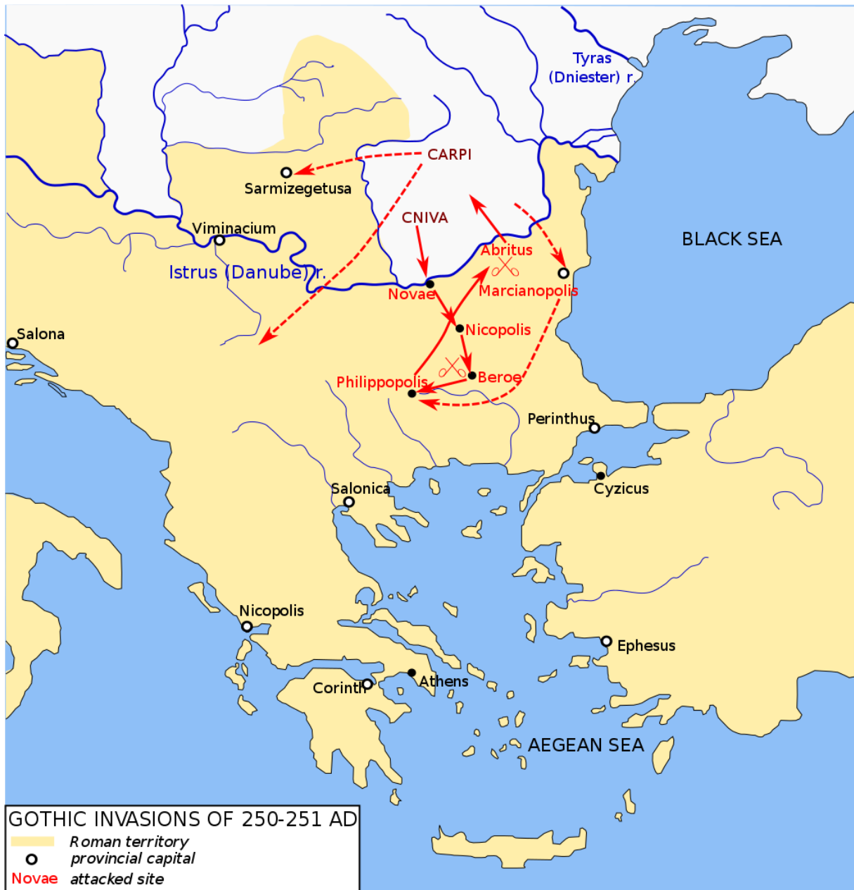
Gotische invasies in de Balkan in 250 en 251 n.Chr., waaronder de Slag bij Abritus