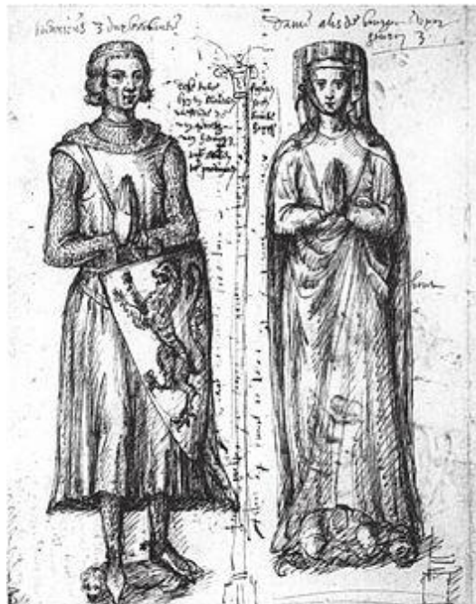
Hendrik III en Aleidis

Hendrik trouwde in 1251 met Aleidis van Bourgondië, dochter van Hugo IV van Bourgondië. Hendrik steunde de kandidatuur voor het Duitse koningschap van Alfons X van Castilië, door wie hij in 1257 werd aangesteld tot handhaver van de vrede in de westelijke rijksgedieden.