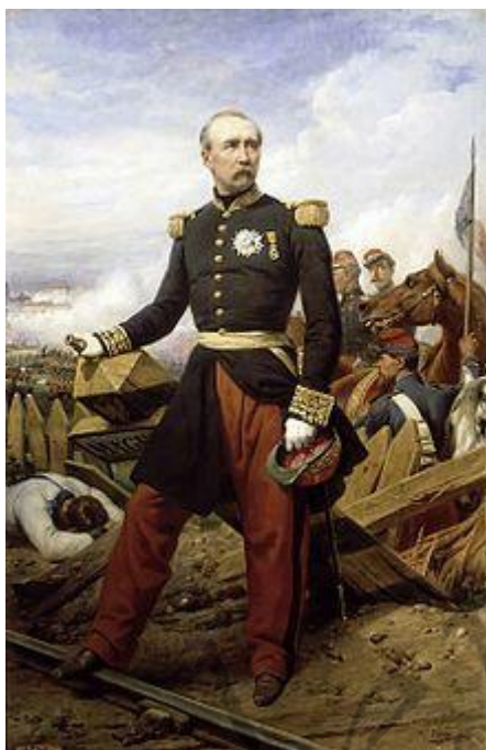
Patrice de Mac-Mahon

Van mei tot september 1877 was Fallières opnieuw burgemeester van Nérac.