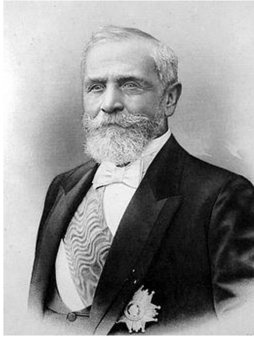
Officieel portret van Émile Loubet