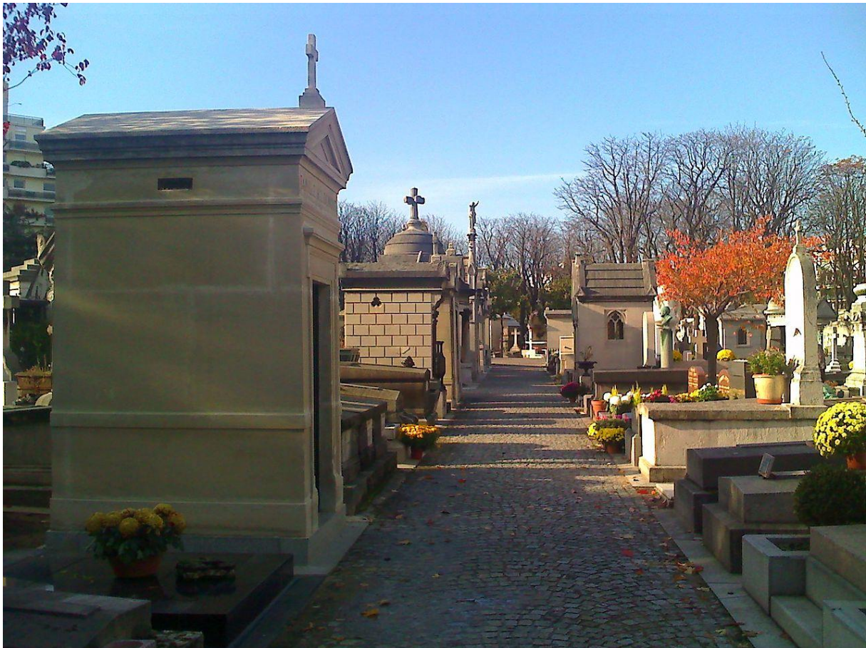
Het cimetière de Passy

Op 7 april 1943 stierf Alexandre Millerand en werd begraven in het Cimetière de Passy.