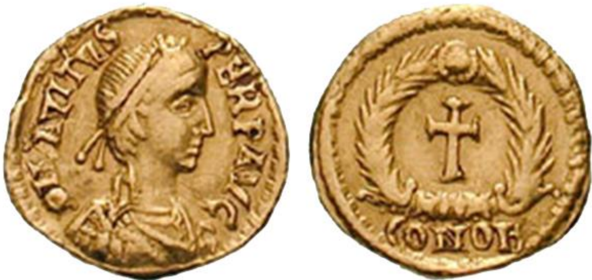
Keizer Avitus op een tremissis (munt).

Marcus Maecilius Flavius Eparchius Avitus (ca. 395 - 457) was West-Romeins keizer van 9 juli 455 tot 17 oktober 456.