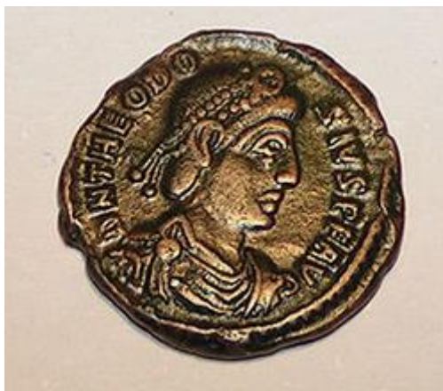
munt met afbeelding van Romeins Keizer Theodosius I.