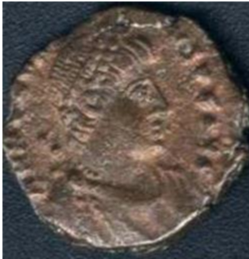
Munt met afbeelding van Keizer Honorius.

Flavius Honorius (384 - 423) was een Romeins keizer van 395 tot 423, en de jongere zoon van Theodosius I en de broer van Arcadius, die keizer van het Oosten werd. Na de dood van Theodosius in 395 was het Romeinse rijk definitief in tweeën gesplitst.