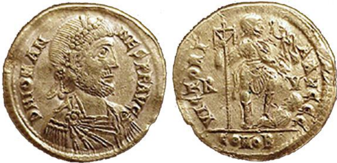
Solidus (munt) van Keizer Johannes.

Johannes (? - juli 425) was West-Romeins keizer van eind 423 tot de zomer van 425. Hij werd niet erkend door de Oost-Romeinse keizer Theodosius II, en wordt daarom usurpator genoemd.