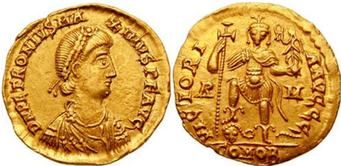
Solidus (munt) van Keizer Petronius Maximus.

Petronius Maximus (ca. 397 - 22 mei 455) was West-Romeins keizer van 17 maart tot 22 mei 455.