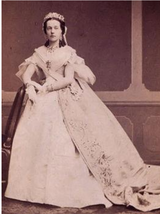
Maria Hendrika, Tweede Koningin der Belgen