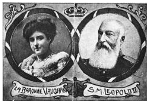
Leopold en barones de Vaughan

In december 1909 onderging Leopold een darmoperatie, waarna hij een paar dagen later overleed aan een hersenbloeding. Leopold was exact 44 jaar koning en is daarmee vooralsnog de langst regerende Belgische vorst. Zijn lichaam werd bijgezet in de Koninklijke crypte in de kerk van Laken