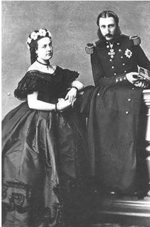
Maria Hendrika van Oostenrijk en Leopold II van België

Nadat de koningin in 1902 overleden was, kreeg Leopolds minnares Blanche Delacroix, barones de Vaughan (1883-1948), een vaste residentie in Laken, in de Villa Vanderborght en ook een in Oostende.