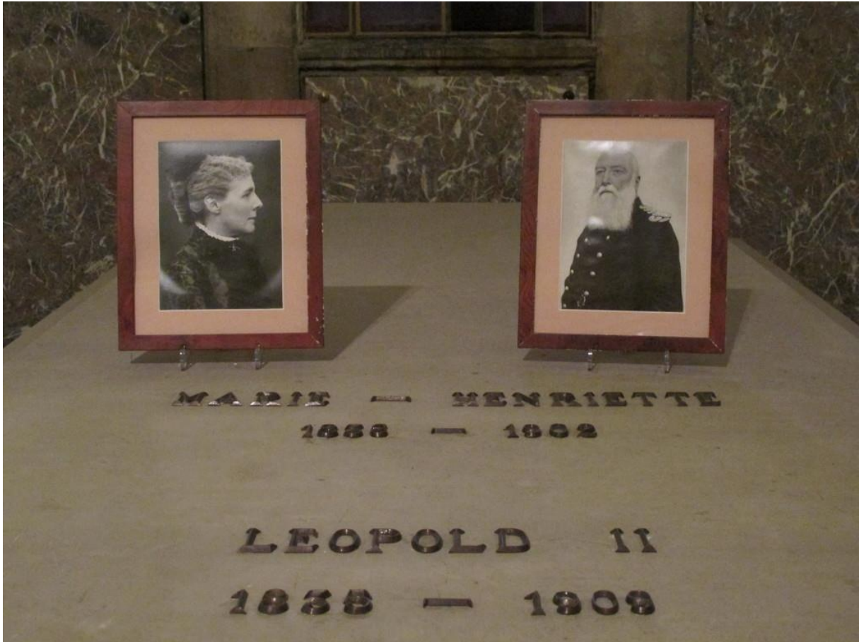
Koninklijke crypte van Marie Henriette ( Maria Hendrika ) en Leopold II