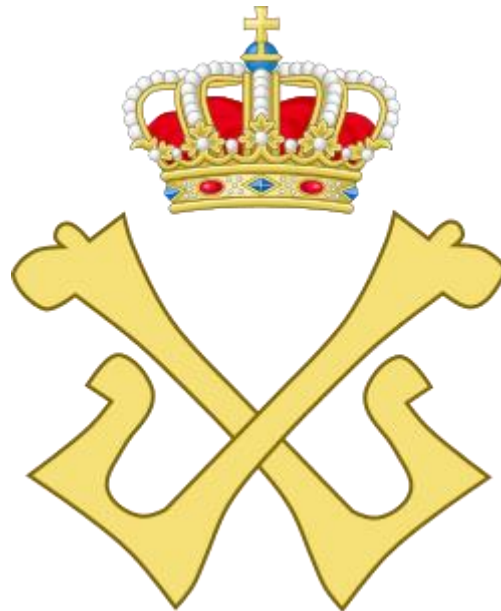
Koninklijk monogram van Leopold II.