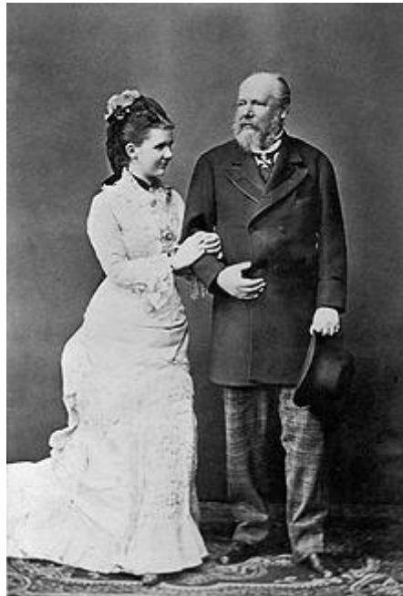
Koning Willem III en Emma van Waldeck-Pyrmont. De foto werd als ansichtkaart op de Nederlandse markt gebracht.