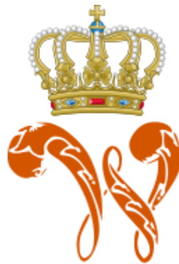
Monogram van koning Willem III