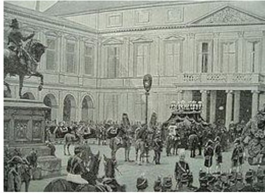
De laatste gang van de koning van Paleis Noordeinde naar Delft