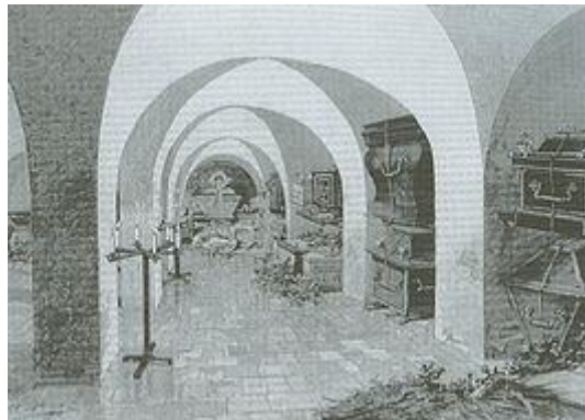
Grafkelder van Oranje-Nassau