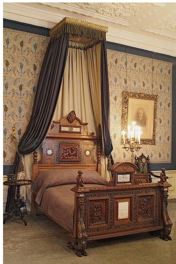
Het sterfbed van koning Willem III