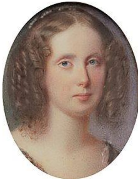
Willems eerste echtgenote prinses Sophie van Wurtemberg

Het was een slecht huwelijk. Op 25 augustus 1851 beviel Sophie van haar derde kind. Het bracht geen huwelijksgeluk, want ze wilde opnieuw van haar echtgenoot weg. Op 17 september dat jaar gaf Willem de opdracht om daarvoor de mogelijkheden uit te zoeken. Uiteindelijk leidde dit op 25 december 1855 tot het ondertekenen van een schriftelijke overeenkomst waarbij – zonder tussenkomst van een rechter – overgegaan werd tot een scheiding van tafel en bed. Tevens werd de belofte vastgelegd dat als Willem zou aftreden als vorst, overgegaan zou worden tot een formele echtscheiding. Willem kreeg het gezag over hun oudste zoon toegewezen, met de verplichting dat die zijn moeder regelmatig moest bezoeken. De jongste zoon, die op dat moment vier jaar oud was,