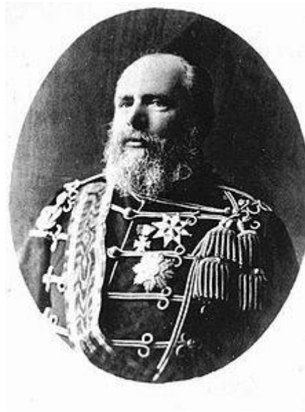
Willem III in zijn laatste jaren

verzwijgen? Ik heb hem nooit geveleid bij zijn leven en denk het niet te doen na zijn dood." De witte bloemen op de baar waren van de jonge Wilhelmina, met de tekst: Voor vader, van zijn lieve kind. Willem III vond zijn laatste rustplaats in de koninklijke grafkelder.