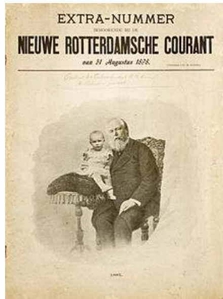
Voorpagina van de Nieuwe Rotterdamse Courant ter gelegenheid van de achttiende verjaardag van koningin Wilhelmina. Op de foto koning Willem III met zijn dochter.