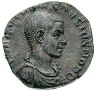
Portret van Herennius Etruscus op een sestertius.

Trebonianus Gallus, stadhouder van Moesia, volgde hem op. Hij zou ook Decius' tweede zoon Hostilianus adopteren en hem tot medekeizer benoemen.