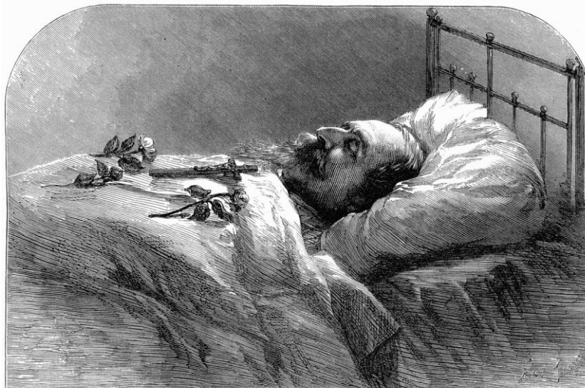
NAPOLÉON III. AFTER HIS DEATH. ENGRAVED, BY SPECIAL PERMISSION, FROM THE PHOTOGRAPH BY MESSRS. DOWNEY.

THE ILLUSTRATED LONDON NEWS, JAN. 25, 1873.—80