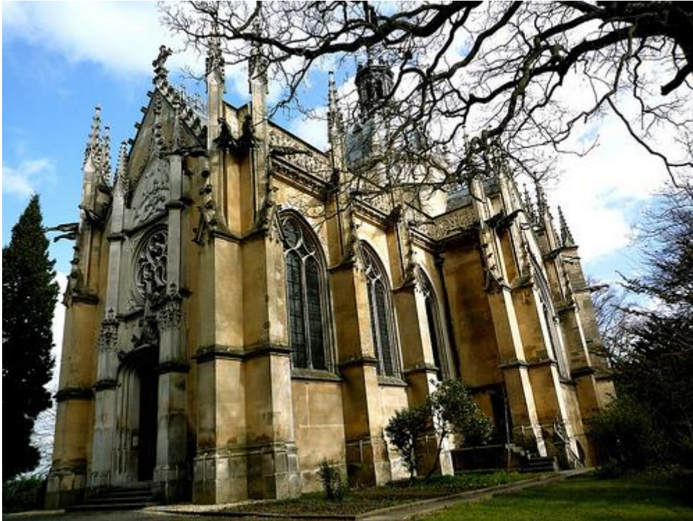
Sint-Michaelsabdij te Farnborough