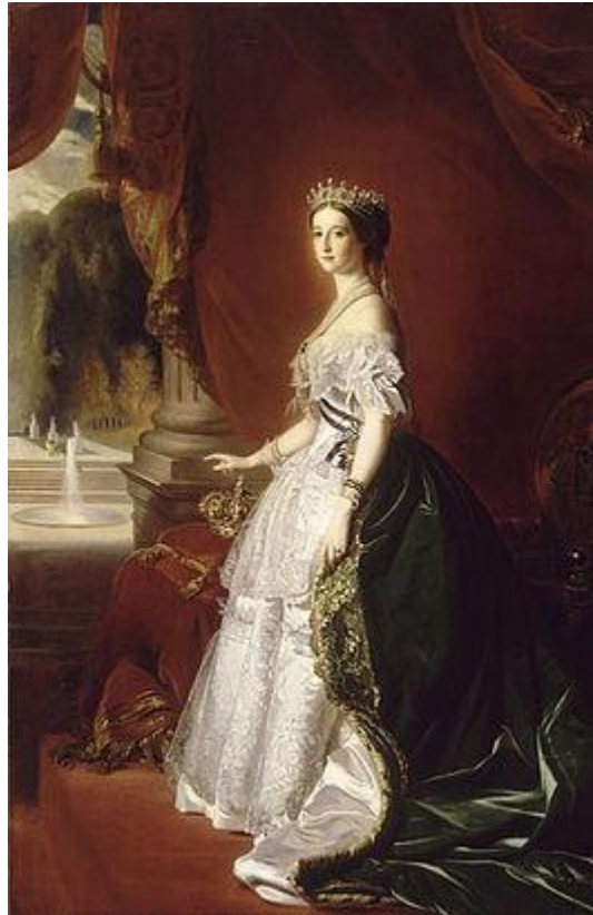
Eugénie; keizerin der Fransen. Zij draagt de Maria-Luisa-Orde

Napoleon III overleed hij in 1873 in Engeland, hij werd 64 jaar oud, en werd begraven in de Sint-Michaelsabdij te Farnborough. Zijn enige zoon Napoleon Eugène Lodewijk werd door bonapartisten tot 'Napoleon IV' uitgeroepen. Hij zou echter nooit regeren.