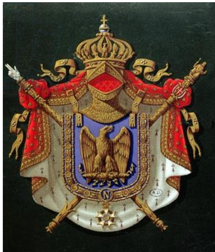
Wapen van Napoleon III