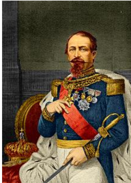
Napoleon als keizer

Lodewijk Napoleon werd in 1808 in Parijs geboren als zoon van Lodewijk Napoleon Bonaparte, koning van Holland en diens echtgenote Hortense de Beauharnais. Hij had twee oudere broers, Napoleon Karel (1802, overleden voor de geboorte van Lodewijk Napoleon) en Napoleon Lodewijk (1804). Het huwelijk van zijn ouders was ongelukkig. Sinds 1807 leefden zij gescheiden. Lodewijk Napoleon werd verwekt tijdens een moment van toenadering, maar kort daarop was de breuk tussen de ouders definitief. Koning Lodewijk Napoleon was bij de geboorte en de doop van zijn jongste zoon niet aanwezig